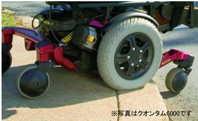
※写真はクオンタム6000です