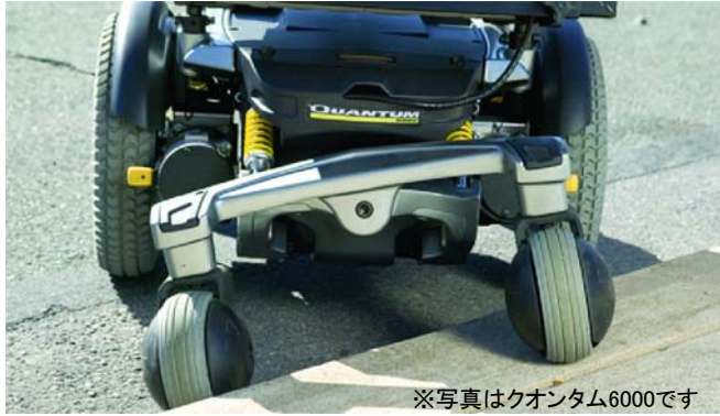
※写真はクオンタム6000です