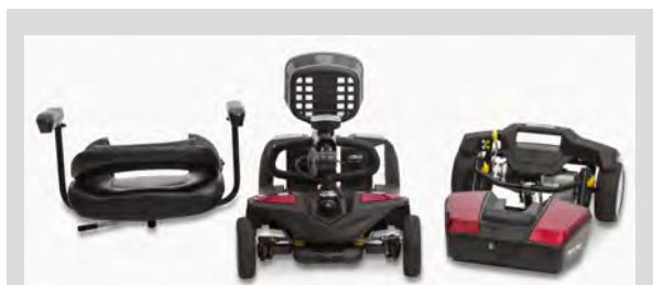
5つのパーツに分解可能 ※下図はゴーゴの分解写真です。