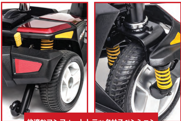
快適なコンフォートトラックサスペンション

ゴーゴーLXは小型軽量でありながら独立した四輪コンフォートトラックサスペンション機能により新しいレベルの機能性とパフォーマンスを提供します。工具を使わずに簡単分解可能ですので、自動車のトランクに積み込み運んで、旅行先で使用したり、バッテリーボックスを取り外して室内で充電も可能です。